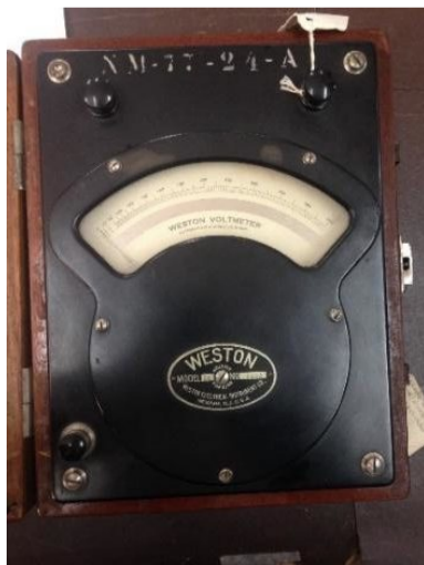
Fig. 10 Voltímetro vuelto a ensamblar