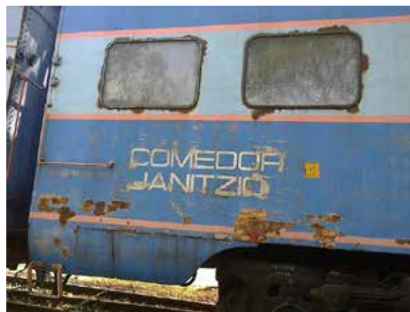
NM 3681 - Coche Comedor "Janitzio" antes de su restauración exterior. 23

Desde su ingreso a las colecciones del Museo Nacional de los Ferrocarriles Mexicanos en abril de 1988, se han llevado a cabo diversas intervenciones de conservación y restauración. De inicio, los trabajos fueron enfocados a la prevención de deterioros activos debido a filtraciones que presentaba en el techo y paredes. Se llevó a cabo la impermeabilización y también otros trabajos de conservación exteriores que consistieron en tratamiento anticorrosivo de las zonas donde se encontraba corrosión activa, eliminación de pintura que se estaba desprendiendo, aplicación de primario y pintura exterior. Se decidió conservar el esquema de pintura que portaba de FNM, en vez de cambiar al esquema del ferrocarril Northern Pacific para conservar la segunda historicidad del coche, cuando estuvo dando servicio a los pasajeros en México. Es importante mencionar que no se eliminaron las capas inferiores de pintura para conservar esos vestigios de su historia.