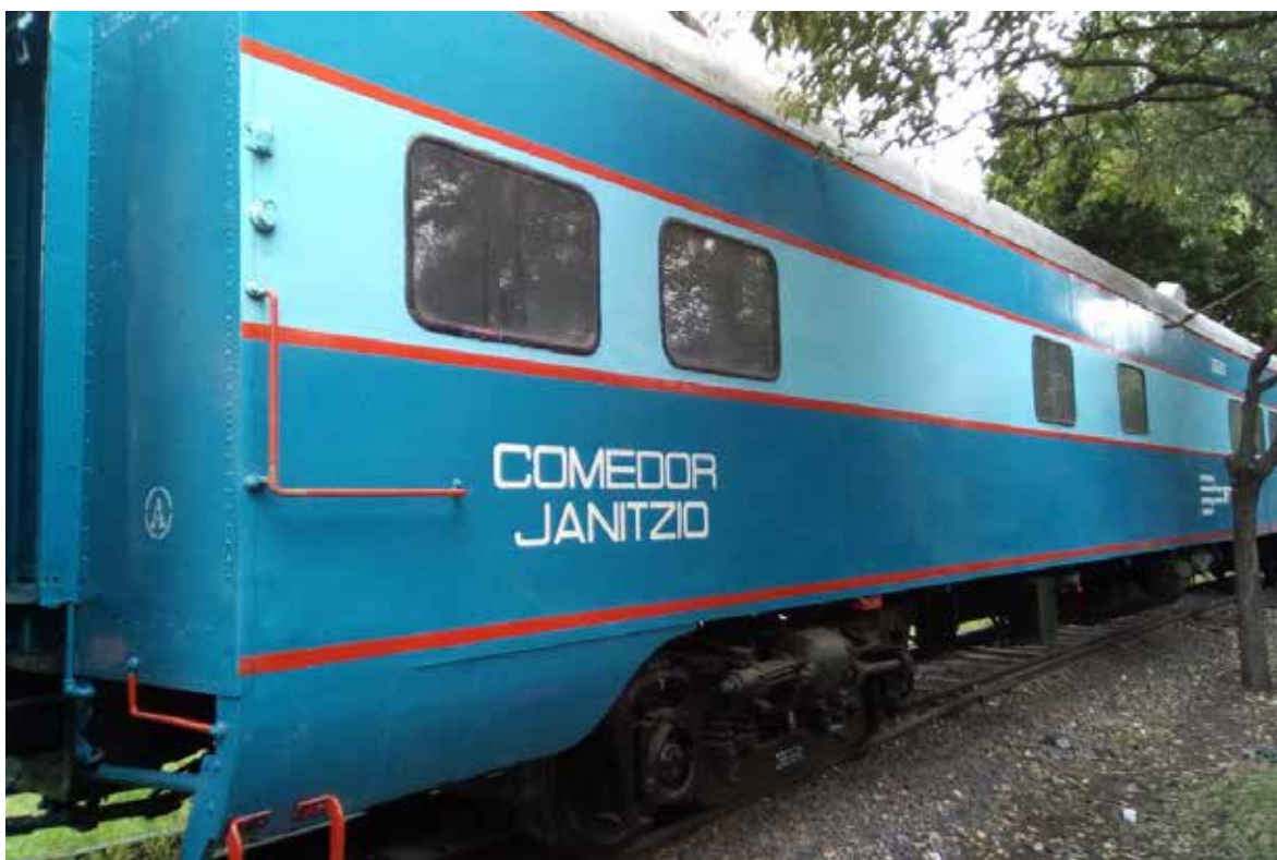
NM 3681 - Coche Comedor “Janitzio” después de su restauración exterior en el Museo Nacional de los Ferrocarriles Mexicanos 25

En el interior los trabajos han consistido en limpieza del acero inoxidable de las rejillas de calefacción y del mobiliario de la cocina. También la reconstrucción de partes faltantes de los sillones tipo bahía y de las mesas del lado del salón.