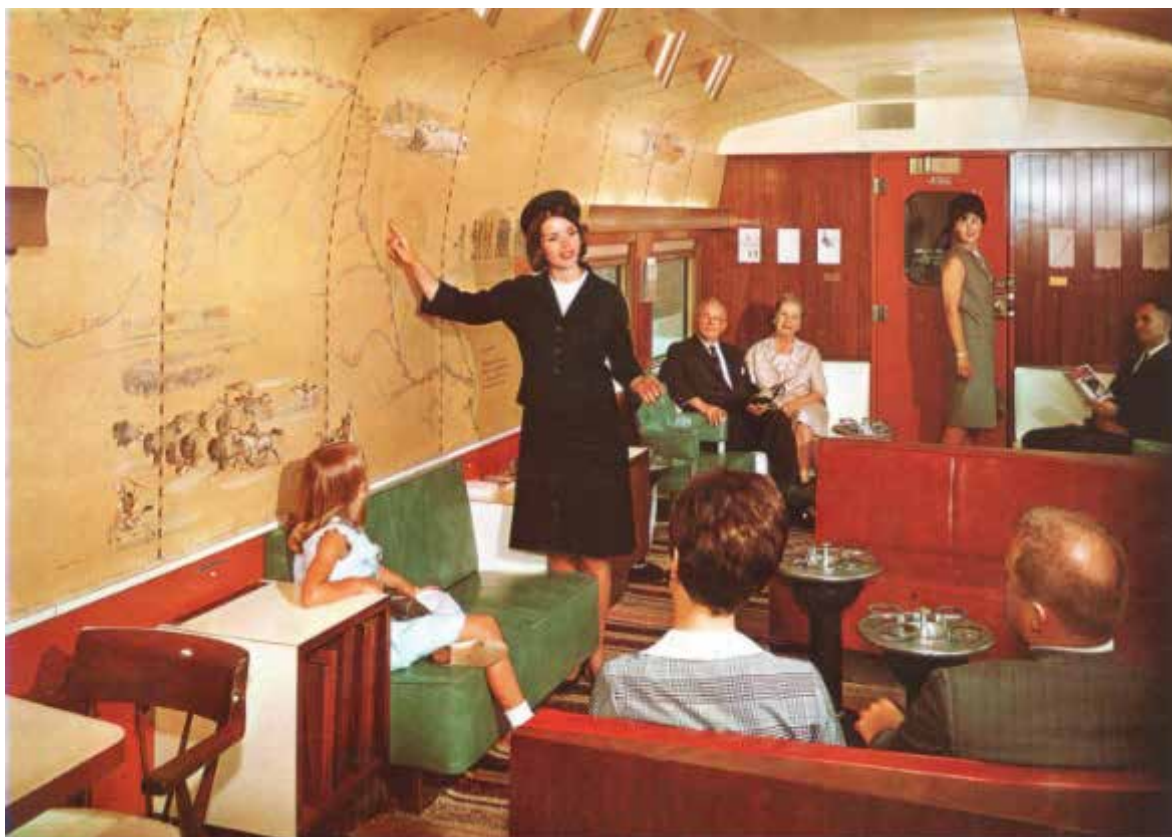
Postal promocional del NP de un coche “Traveller’s Rest” 8

coches. En las paredes, el artista norteamericano Edgar Miller 6 pintó murales que relatan la historia de la expedición Lewis and Clark, 7 la cual es importante en la historia de Estados Unidos. Debido a que el soporte de imitación piel de material plástico no recibía adecuadamente las pinturas de aceite, el artista desarrolló una técnica especial con base en materiales plásticos pulverizados.