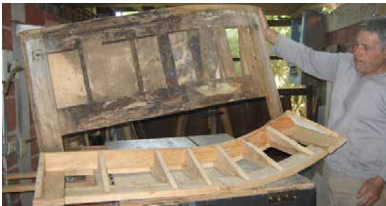
Trabajos de restauración de sillones del coche NM 3681 - Comedor “Janitzio”. 24

En el interior los trabajos han consistido en limpieza del acero inoxidable de las rejillas de calefacción y del mobiliario de la cocina. También la reconstrucción de partes faltantes de los sillones tipo bahía y de las mesas del lado del salón.