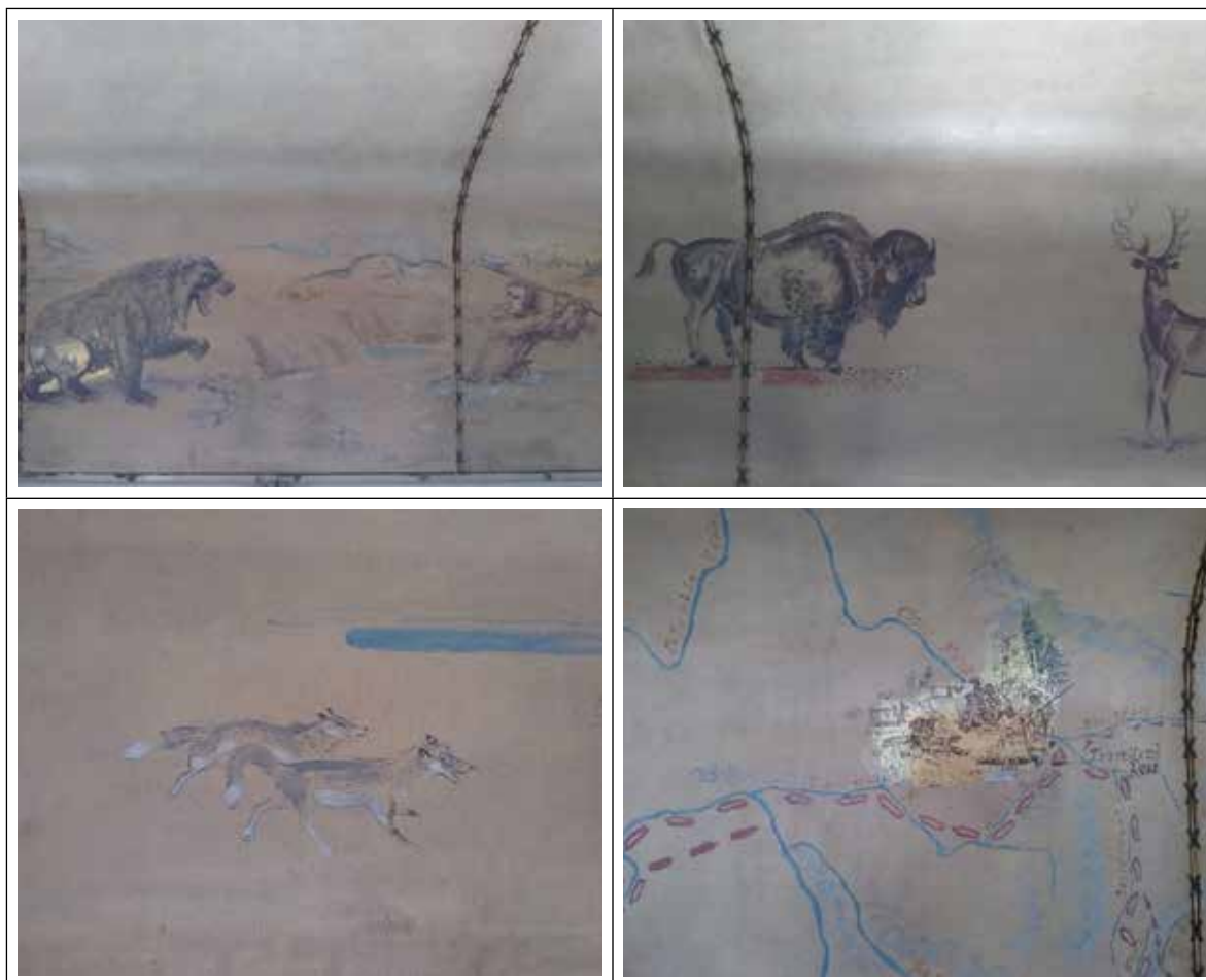
Detalles de los murales en el coche NM 3681. 11